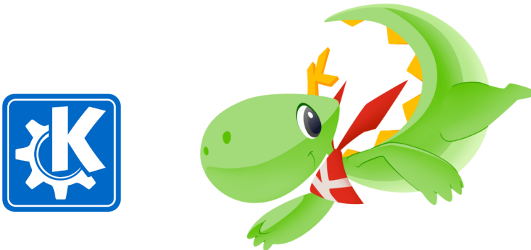
Figure 1.3 : Logo de KDE et Konqi, sa mascotte dessinée avec Krita

Développé principalement sur le système d'exploitation libre GNU/Linux, il dispose actuellement d'une version Windows relativement stable et performante, ainsi que d'une préversion de test pour macOS mais celle-ci est loin d'être stable ou complète pour l'instant et n'est donc pas recommandée en production.