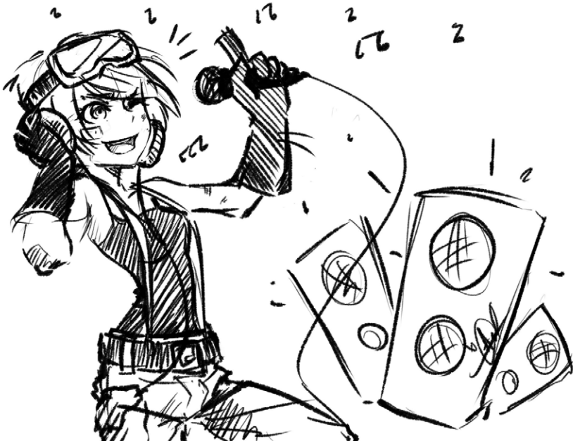
Figure 1.4 : "Mechanic-sister sings karaoke" par Anastasia Majzhegishева