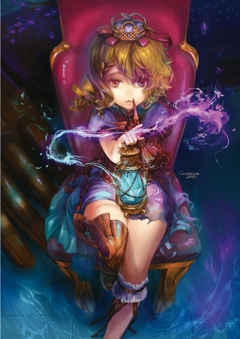
Figure 1.5 : "Girl to protect the sleep" by Comamitsu Zaki

Cet extrait provient du livre Dessin et peinture numérique avec Krita (2 e édition) écrit par Timothée Gilet - © 2018 Éditions D-Booker